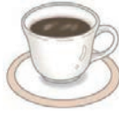
エスプレッソ コーヒー