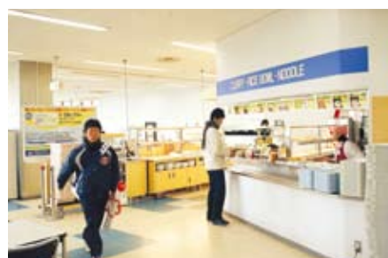
07 식당-레스토랑 뷔페식 레스토랑도 있어 학생들에게 인기가 높습니다.