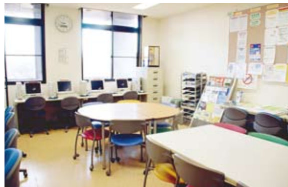
02 국제센터(담화실) 유학생 여러분이 공부하거나, 교류의 장소로서 자유롭게 이용할 수 있는 방입니다. 인터넷을 사용하거나, 리포트를 작성할 수 있습니다.