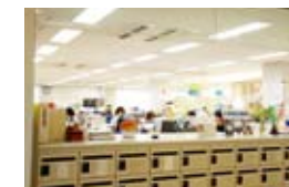
12 교무과-학생 서비스과 이수 신청을 받고 각종 수속 업무를 담당하는 곳입니다.