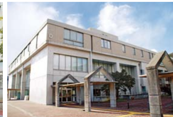
10 부속 도서관 책과 잡지의 대출 및 그 밖의 전자 미디어나 인터넷 단말기의 제공 등 정보에 광범위하게 접할 수 있는 환경이 정비되어 있습니다.