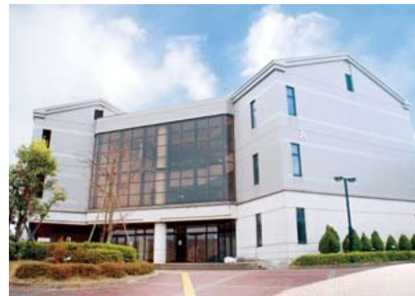
01 공통 강의동 (A) 강의실, 시청각 교실, 정보처리 실습실, CALL교실 등이 있습니다.