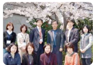
국제센터와 국제계의 직원