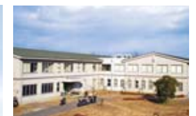
14 야외 활동 시설

40실을 준비하여 유학생에게 거주할 수 있는 장소를 제공하고 있습니다. 각 방에는 화장실, 세면대, 침대, 냉장고, 에어컨, 학습 책상, 책장, 의류보관함을 완비하고 있습니다. 주방, 샤워, 세탁기 등은 공동으로 사용합니다. 이 밖에 캠퍼스 밖에도 유학생 기숙사가 9실 준비되어 있습니다. 각 방에서 인터넷도 이용할 수 있습니다.