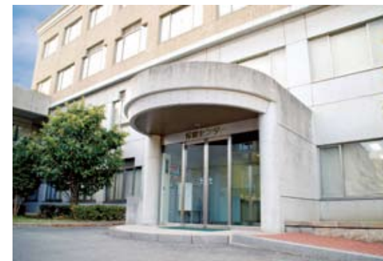
09 보건 센터 아프거나 부상을 당했을 때는 응급처치를 받을 수 있습니다. 또한, 심신상의 고민이 있으면 전문 카운슬러에게 상담할 수도 있습니다.