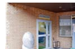
11 캐리어 서포트 데스크 취직에 관해서 풍부한 전문 지식을 가진 직원이 여러가지 상담에 대응해 줍니다.