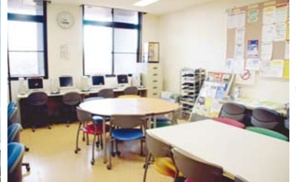
02 국제센터(담화실) 유학생 여러분이 공부하거나, 교류의 장소로서 자유롭게 이용할 수 있는 방입니다. 인터넷을 사용하거나, 리포트를 작성할 수 있습니다.