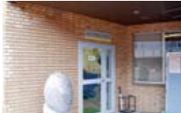
11 캐리어 서포트 데스크 취직에 관해서 풍부한 전문 지식을 가진 직원이 여러가지 상담에 대응해 줍니다.