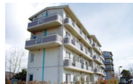
13 유학생 기숙사(학생 기숙사) 40실을 준비하여 유학생에게 거주할 수 있는 정소를 제공하고 있습니다. 각 방에는 화장실, 세면대, 침대, 냉장고, 에어컨, 학습 책상, 책장, 의류보관함을 완비하고 있습니다. 주방, 샤워, 세탁기 등은 공동으로 사용합니다. 이 밖에 캠퍼스 밖에도 유학생 기숙사가 9실 준비되어 있습니다. 각 방에서 인터넷도 이용할 수 있습니다.