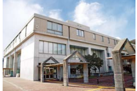
10 부속 도서관

책과 잡지의 대출 및 그 밖의 전자 미디어나 인터넷 단말기의 제공 등 정보에 광범위하게 접할 수 있는 환경이 정비되어 있습니다.