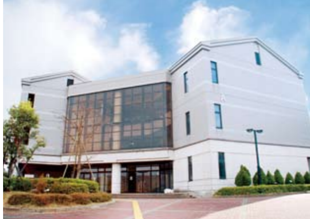
01 공통 강의동 (A) 강의실, 시청각 교실, 정보처리 실습실, CALL교실 등이 있습니다.