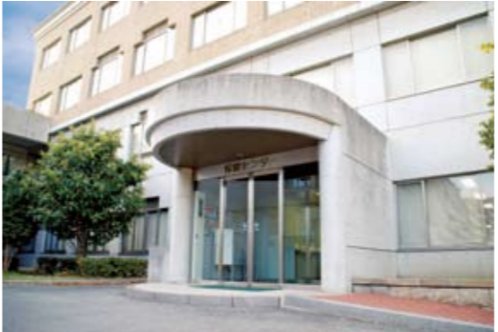
09 보건 센터 아프거나 부상을 당했을 때는 응급처치를 받을 수 있습니다. 또한, 심신상의 고민이 있으면 전문 카운슬러에게 상담할 수도 있습니다.