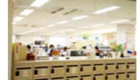
12 교무과-학생 서비스과 이수 신청을 받고 각종 수속 업무를 담당하는 곳입니다.