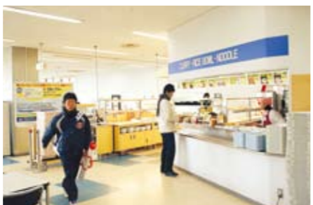
07 식당-레스토랑 뷔페식 레스토랑도 있어 학생들에게 인기가 높습니다.