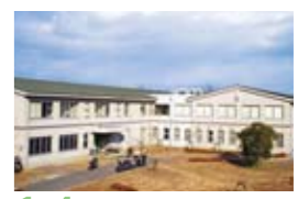
14 과외 활동 시설