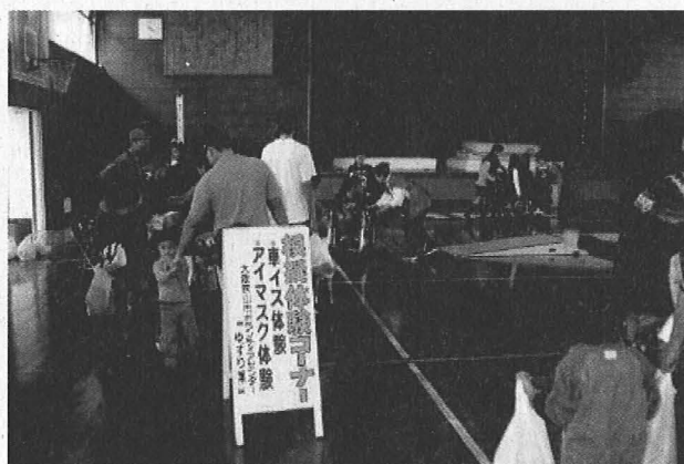
高齢・障がい疑似体験