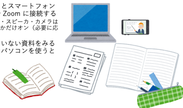
図1 ノートパソコンとスマートフォンの両方で Zoom に接続する受講スタイルの説明スライド。 筆者の担当講義ではこの形態での受講者はいなかった。

PC 環境についてはバッテリーが授業中に切れたことを別の自由記述で書いた学生もいたが、それ以外の記述はなかったため、必携パソコンのスペックで現在の受講スタイルでの受講に支障はなかったと考える。また (12) タッチタイプについて、A 問題なくできると回答した学生が 10 名、B 少しできると回答した学生が 5 名、C できないと回答した学生が 3 名であった。